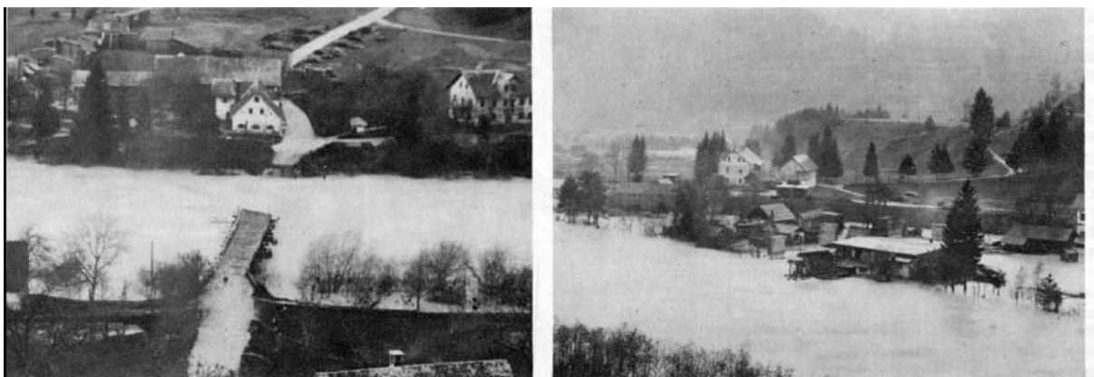
Novo povodnji v Sloveniji. Letošnje leto zadevajo Slovenijo udarei drug za drugim.

Komaj smo se nekoliko oddahnili od strahot septembrskih povodnji, že smo doživeli v noči od 29. na 30. okt. nove vodne katastrofe, ki so prizadele zlasti vso Gorenjsko in nekatere dele Štajerske. Naša leva slika nam kaže raztrgan »Pižov most« čez Savo pri Radovljici, desna slika pa poplavljen tovarno g. I. Dernača na Lancovem pri Radovljici.