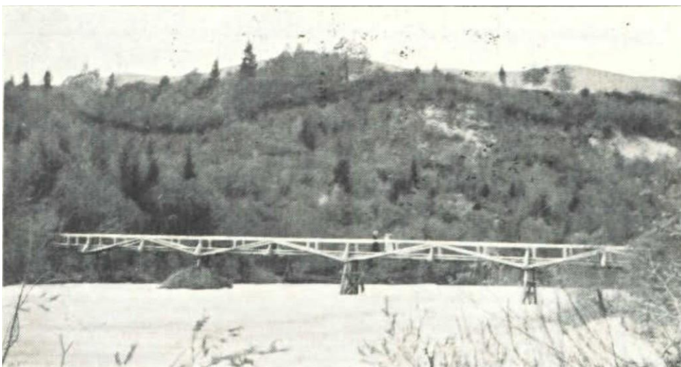
Predtrška brv, ok. 1900.

Vir: Gorenjski muzej Kranj (razglednica, odposlana 1903)