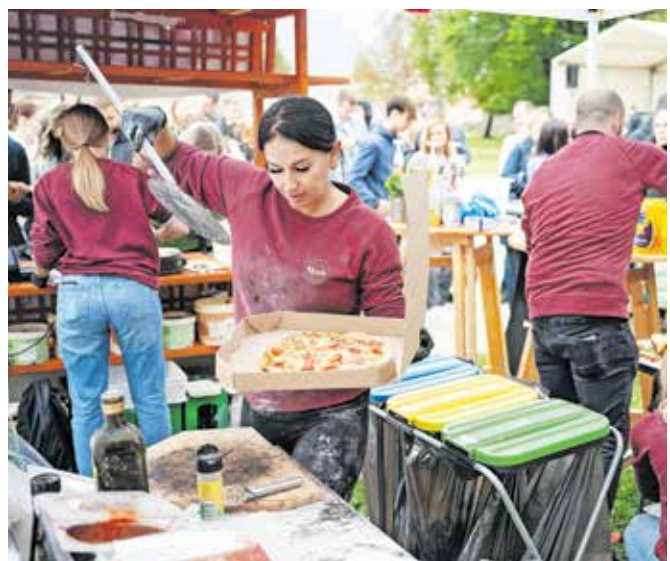
Ves dan se je pred stojnico, na kateri so pripravljali pice in burgerje brez glutena, vila dolga vrsta lačnih ljudi.

noma drugačna. Zelo veliko ljudi celiakije sploh ne pozna, jo zamenjuje z drugimi boleznimi ... ne razumejo, da problem ni samo pšenica, temveč vsi njeni 'potomci', križanci in sorodniki kot na primer pira, ječmen ... Moka