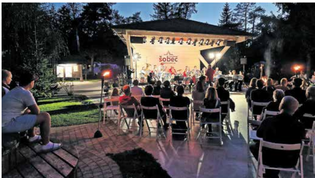
Koncert na Šobcu so naslovili Zvoki poletja

Po aprilskem koncertu in prvomajski budnici je orkester zakoral v aktivno poletje, čeprav mu letošnje vremensko ni bilo naklonjeno. Igrali so na slovesnosti ob državnem prazniku, izvedli mnogo promenadnih nastopov v River campingu, sodelovali na tradicionalnih prireditvah v občini (Ob kresi se dan obesi, Urhov sejem, Kovaški šmaren) in okroglih obletnicah gasilcev Kroke, Radovljice in Ljubnega, sodelovali so na odprtju prenovljenega radovljiškega bazena in na začetku maratona Julian Alps Trail Run, organizirali samostojni koncert s poudarkom na slovenski glasbi v Radovljici (Radovljiška poletna noč) in na Šobcu (Zvoki poletja), gostovali so na Hrvaškem in gostili mednarodni festival orkestrrov. Tako je orkester z različnimi poletnimi nastopi obogatil