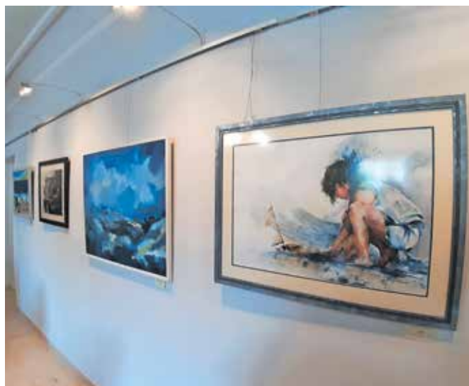
Razstava bo v Galeriji Avla na ogled do 29. novembra.