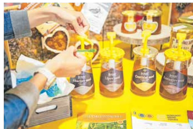
Čebelarska zveza Slovenije je pripravila degustacijo medu iz evropskih shem kakovosti, v katere se lahko vključijo čebelarji in na ta način potrošnikom tudi formalno zagotovijo, da prodajajo med odlične kakovosti.