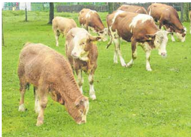
Po podatkih iz zbirnih vlog je lani redilo živino samo še 207 kmetij. Slika je simbolična.

Podatki o stanju kmetijstva v občini kažejo, da se število kmetijskih gospodarstev, površina kmetijskih zemljišč v uporabi in število glav velike živine (GVŽ) v občini zmanjšujejo. Leta 2000 je bilo v občini še 455 kmetijskih gospodarstev, leta 2020 samo še 347. Površina kmetijskih zemljišč se je v tem obdobju zmanjšala z 2611 na 2541 hektarjev, število GVŽ pa s 3248 na 2587. V zadnjih desetih letih se je površina trajnih travnikov zmanjšala za 454 hektarjev, deloma tudi zaradi zaraščanja. Gospodarji