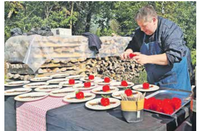
Poudarek letošnje kulinarične jeseni v Radovljici je v povezovanju gostincev in ponudnikov lokalnih sestavin.

Kulinarično jesen v Radovljici dopolnjuje tudi Radolška čokolada, ki v oktobru in novembru pripravlja vodene čokoladne degustacije, 27. oktobra pa edinstveno doži-