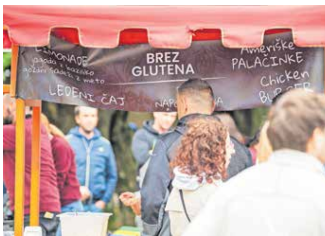
Festival brezglutenskih okusov in zabave je v radovljiški grajski park privabil trume obiskovalcev iz vse Slovenije.

»Domača kuhinja ni problem, saj si večinoma sami pripravljamo jedi tako, kot vemo, da je treba, zunaj doma pa je situacija popol-