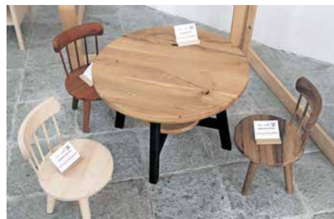
Razstava lesenih izdelkov Čar lesa je v prvem nadstropju Radovljiške graščine na ogled še do konca tega meseca.

»V Sloveniji, eni od z lesom najbogatejših držav Evrope, je zaradi nespametne gospodarske politike lesna industrija na robu preživetja,« poudarjajo. »Les bi zato morali opredeliti kot nacionalno strateško surovino ter iz njega proizvajati izdelke z najvišjo dodano vrednostjo.« Kot še poudarjajo, bi morali v naslednjem desetletju v