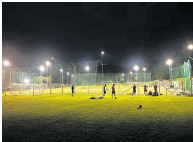
Športniki, ki delujejo v okviru NK Lesce, bodo lahko trenirali tudi v večernih terminih jesensko-zimskih in zgodnjepomladanskih mesecev, kar do zdaj zaradi teme ni bilo mogoče.

»Stotnije otrok, mladih in manj mladih športnikov, ki delujejo v okviru NK Lesce, bodo tako lahko trenirale tudi v večernih terminih jesensko-zimskih in zgodnjepomladanskih mesecev, kar do zdaj zaradi teme ni bilo mogoče,« so poudarili.