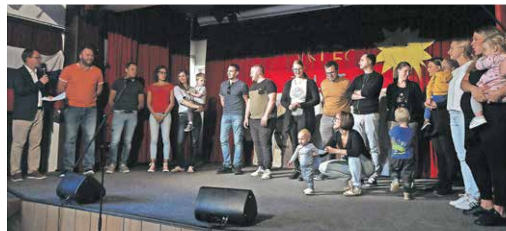
Za to posebno priložnost so na oder kulturnega doma stopili tudi predstavniki prve generacije otrok, ki so obiskovali vrtec Brezje. Kar precej jih je bilo, številni danes v vrtcu vsako jutro pospremiijo svoje otroke.