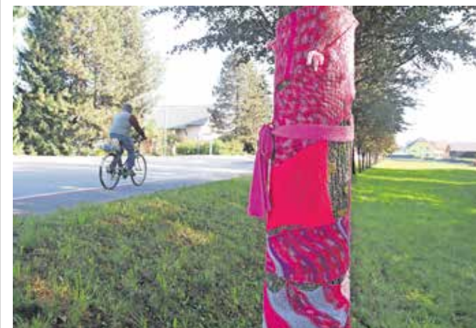
V rožnate pletenine so ovita tudi drevesa ob cesti med Lescami in Radovljico.

Za zgodnje odkrivanje raka dojk je pomembno tudi, da se ženske odzovejo na vabila državnega presejalnega programa DORA, ki je namenjen zgodnjemu odkrivanju raka dojk in v okviru katerega vsaki dve leti na mamografijo povabijo vse slovenske ženske med 50. in 69. letom starosti. Samopregledovanje naj ženske nadaljujejo tudi tkrat, ko se redno udeležujejo presejalne mamografije.