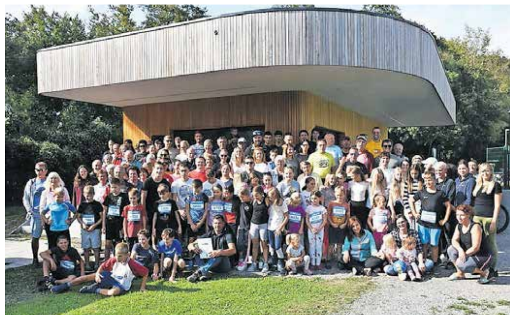
Domačini iz Vrbenj in Gorice so se tudi letos veselili tradicionalnega druženja v športnem parku, kjer od lani stoji tudi sodoben večnamenski objekt.