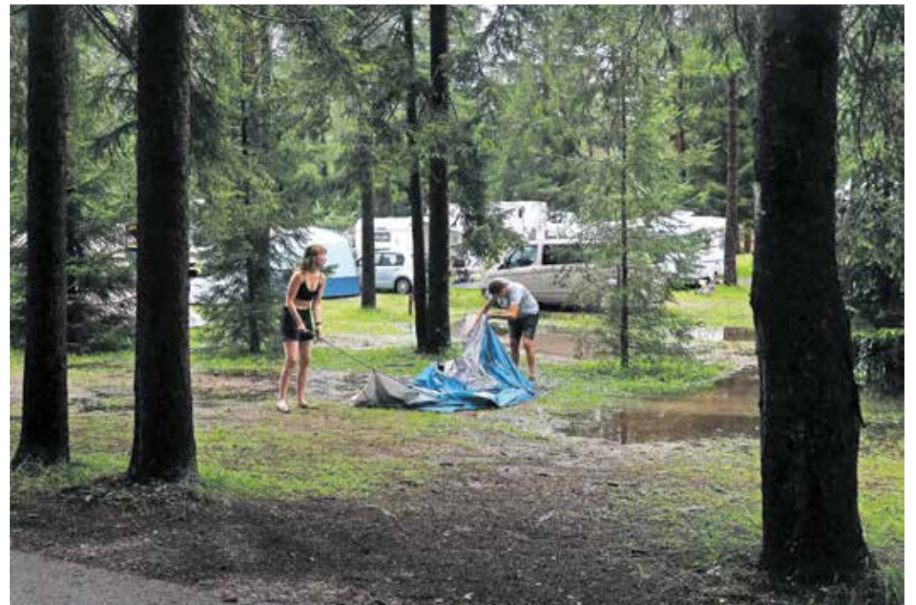
Vreme je avgusta močno zmanjšalo predvsem obisk v kampih, ki sicer na območju destinacije ustvarjajo največ nočitev.

»Z vidika razvoja turizma je dvig nočitev v mesecih pred sezono pomemben kazalec