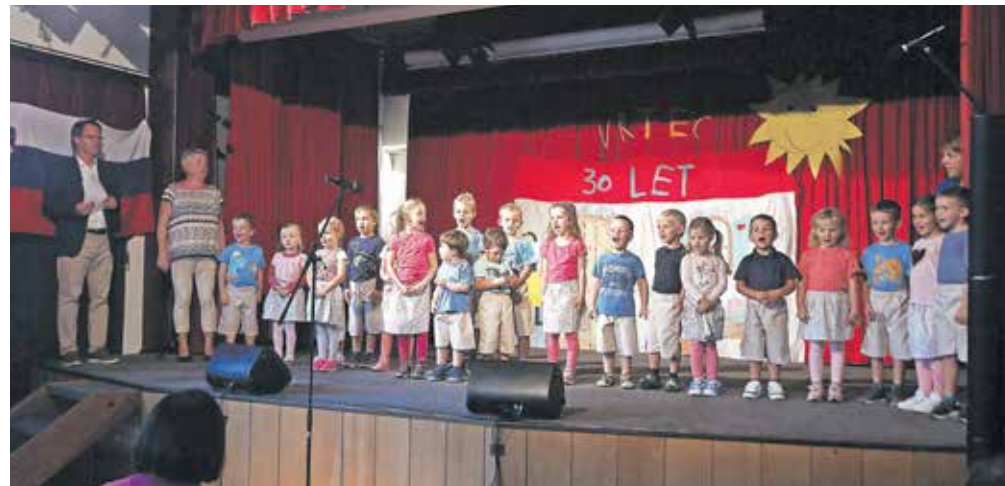
Na prireditvi so nastopili skoraj vsi otroci, ki danes, razdeljeni v tri skupine, obiskujejo vrtec Brezje.

»Ta vrtec je tako poseben, da je nemogoče, da ga ne bi imel rad,« je svoje vtise o letih, ki jih je preživela kot vzgojiteljica v vrtcu na Brez-