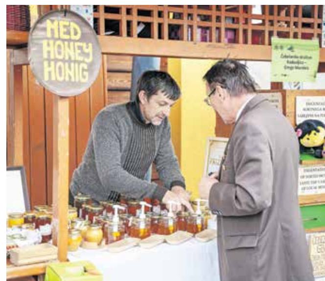
Ponudnikov na stojnicah je bilo letos, verjetno zaradi slabega vremena, nekaj manj kot prejšnja leta, a so tisti, ki so se na prireditvi predstavili, obiskovalcem z veseljem razložili vse, kar jih je zanimalo o medu in čebelarjenju.