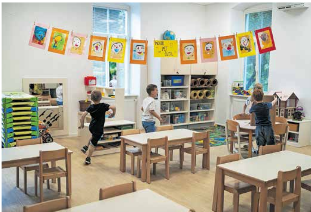
Cene programov vrtca se s prvim novembrom višajo za približno šest odstotkov. Fotografija je simbolična.

Tisti, ki plačujejo 35 odstotkov polne cene, bodo na mesec v povprečju plačevali dobrih 13 evrov več kot doslej.