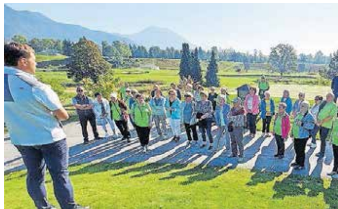
Skupina Leščanov se je v začetku oktobra odpravila na obisk na bližnje golfsko igrišče.