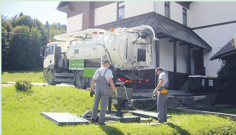
Ekipa Komunale Radovljica na terenu