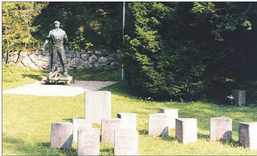
Spomenik pred uničenjem