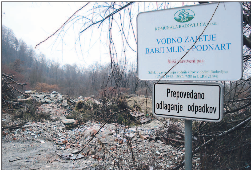
Odlagališče na širšem vodovarstvenem območju vodnega zajetja Babji mlin

Podnart - "Novo vodstvo krajevne skupnosti se že vse od izvolitve prizadeva, da bi skupaj z občino in Komunalo Radovljica uredili odlagališče gradbenih odpadkov ob cesti iz Podnarta proti Prezrenjam. Predlagamo takojšnjo sanacijo oz. zasutje odlagališča," je povedala predsednica sveta KS Darija Bešter in dodala, da je bilo to odlagališče nekdanje namenjeno odlaganju gradbenih odpadkov z območja domače krajevne skupnosti. Čeprav so odlagališče zavarovali z rampo, ki je bila zaklenjena, s tem niso mogli preprečiti, da ne bi občani tja "na črno" odlagali tudi komunalnih odpadkov. Problem je še toliko večji, ker lastništvo zemljišča, na katerem je odlagališče, ni urejeno in ker se odlagališče nahaja na širšem vodovarstvenem območju vodnega zajetja Babji mlin, iz katerega se s pitno vodo oskrbujejo gospodinjstva iz Podnarta in dela Ovsiš. Krajevna skup-