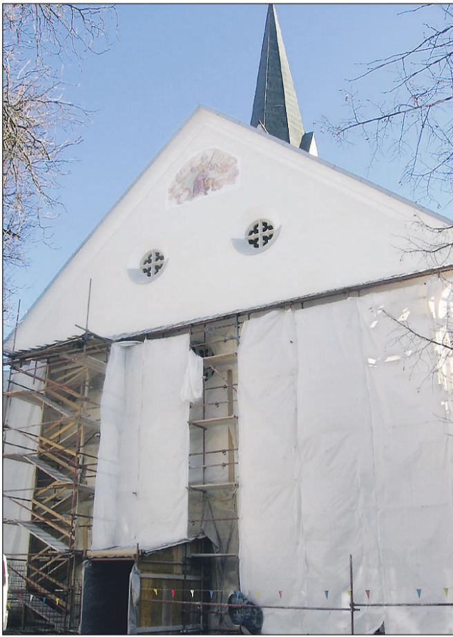
Cerkev med obnovo fasade

daje značilno podobo in tako si tudi Radovljice ne moremo predstavljati brez nje.