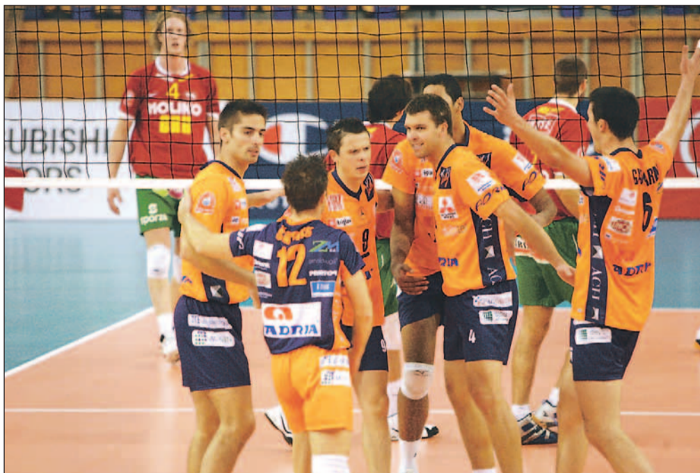
Blejski odbojkarji

Radovljica - Blejski odbojkarji so se v uspešni lanski sezoni uvrstili v elitno evropsko ligo prvakov. Žreb jih je dodelil v skupino, v kateri so za nasprotnike dobili belgijski Noliko, francoski Paris Volleys in moskovski Dinamo. Zastavili so si cilj, da čim bolj drago prodajo svojo kožo in da na najlepši način predstavijo slovensko odbojko v Evropi. Skrite želje pa so bile tri zmage. Predpisi so bili strogi, ena od ovir je bila tudi premajhna radovljiška dvorana, zato so se odločili za ljubljanski Tivoli. Premierni nastop v ligi prvakov se je končal sanjsko, na kolena so spravili Noliko. Sledilo je gostovanje v Moskvi, kjer bi bilo vse drugo, razen zmage gostiteljev, ogromno presenečenje. Blejci so sicer izgubili s 3:0, a so se zelo dobro upirali. Sledili sta tekmi s Parizom, najprej v razprodanem Tivoliju in nato še v gosteh. V Tivoliju so gledalci videli pet nizov, v odločilnem nizu je našim prvakom kazalo slabo, a je sledil preobrat in zmaga je ostala doma. Pov-