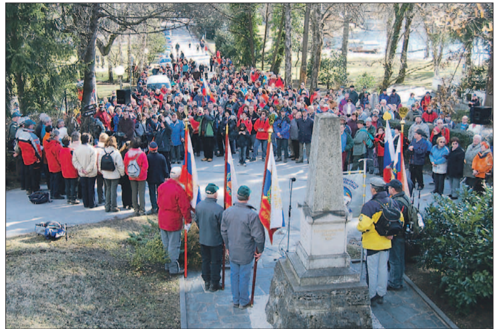
Veterani ob Prešernovem spomeniku na Bledu