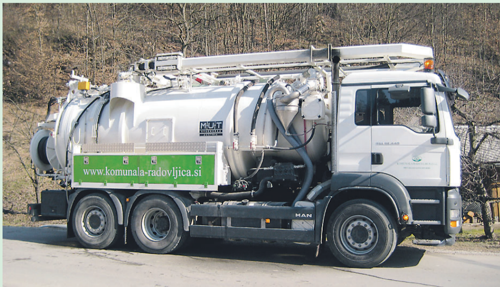
Novo fekalno vozilo Komunale Radovljica, s katerim se izvaja praznjenje greznic in čiščenje kanalizacije